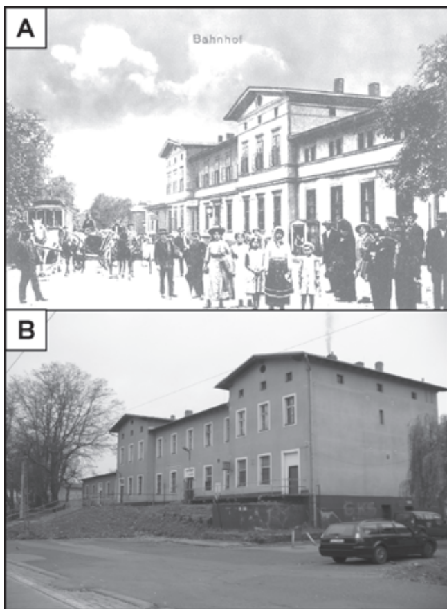
Fot. 2. Dworzec kolejowy na początku XX w. (A) oraz w 2013 r. (B)

Drugim istotnym efektem przemian zabudowy miejskiej jest jej przebudowa. Takim zabiegom poddano m.in. remizę strażacką, do której dobudowano dwa segmenty, jak również zmianie uległy budynki usługowe przy pl. Wolności oraz lokomotywnia. Interesującym przykładem przebudowy wraz ze zmianą funkcji budynku jest zaadaptowanie dawnej walcowni cynku na sklep sieciowy „Biedronka”. Duże przemiany przeszedł także dworzec kolejowy. Współcześnie istniejący budynek dworca powstał w 1869 r. (wg danych Polskich Kolei Państwowych) i uległ kilkukrotnej przebudowie. Na planie miasta z 1910 r. widnieje dworzec rozbudowany w kierunku północnym, jednak już w 1930 r. owej przybudówki nie ma. Najprawdopodobniej obniżenie terenu przed budynkiem dworca oraz wyburzenie wspomnianego segmentu północnego nastąpiło wraz z budową przejścia podziemnego po I wojnie światowej (fot. 2). Zamieszczone fotografie ukazują dynamikę przemian dotyczącą czterech elementów struktury przestrzennej: zmiany formy samego budynku, ukształtowania terenu, układu komunikacyjnego (linii tramwajowej), a także życia społecznego (przestrzeń przed budynkiem dworca obecnie nie tętni już życiem tak, jak to miało miejsce na początku XX w.).