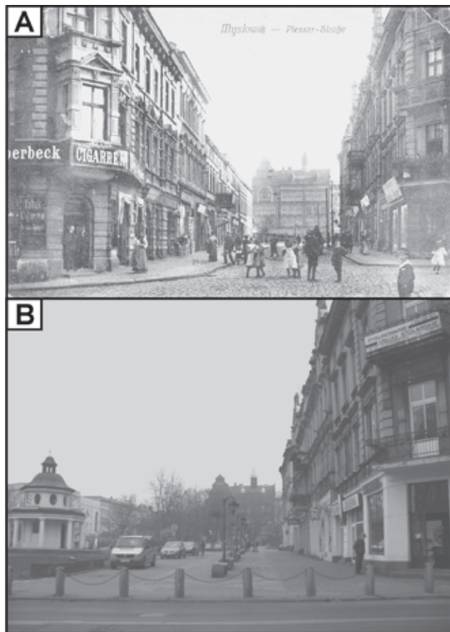
Fot. 1. Zabudowa ul. Grunwaldzkiej na początku XX w. (A) i w 2013 r. (B)

Z przedstawionych danych wynika, iż nastąpił znaczny ubytek tkanki miejskiej. Największe zmiany zaszły wskutek polityki urbanistycznej lat 70. XX w. Przystąpiono wówczas do przebudowy śródmieścia, a w konsekwencji wyburzono kwartał zabudowy mieszkaniowej przy ul. Grunwaldzkiej, w miejscu którego powstało przejście podziemne pod ul. Krakowską wiodącą w kierunku Modrzejowa (dzielnica Sosnowca). Zamieszczone fotografie, obrazujące przemiany przestrzeni tej części badanego obszaru, wykonane zostały od strony północnej na początku XX wieku i w 2013 r. (fot. 1). Wschodnia część ul. Grunwaldzkiej tylko w wyniku przemian w latach 70. XX w. straciła ok. 20 zabudowań gospodarczych i kamienic. Na pustej działce po wyburzonej zabudowie wybudowano kapliczkę św. Jana Chrzciciela (fot. 2B) nawiązując do wyburzonej kapliczki Jarlików z okresu międzywojennego, która niegdyś stała po przeciwnej stronie ul. Krakowskiej (Witecka 2008).