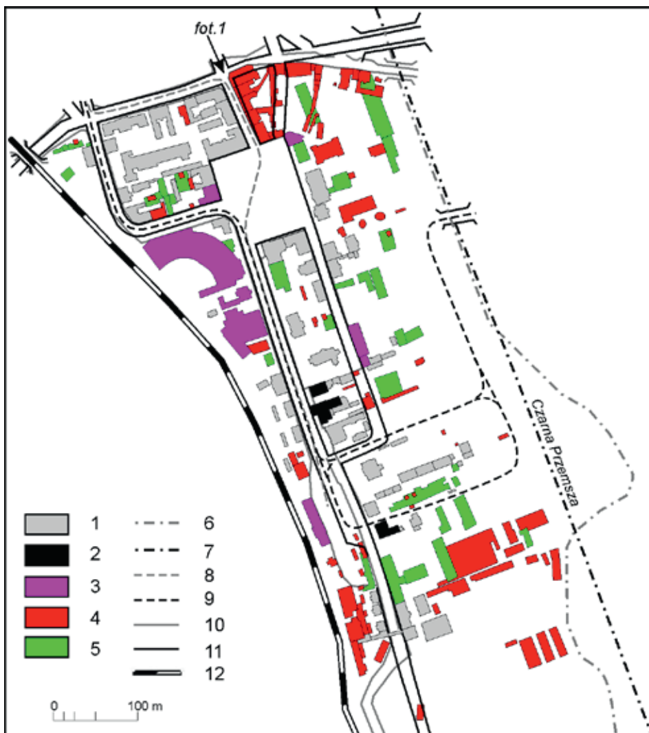
Ryc. 3. Przemiany struktury przestrzennej Nowego Miasta w latach 1859–2013

miasta zachodzą pod wpływem wielu czynników, a zatem wraz ze zmianami funkcjonalnymi obszaru badań podążały zmiany przestrzeni miejskiej.