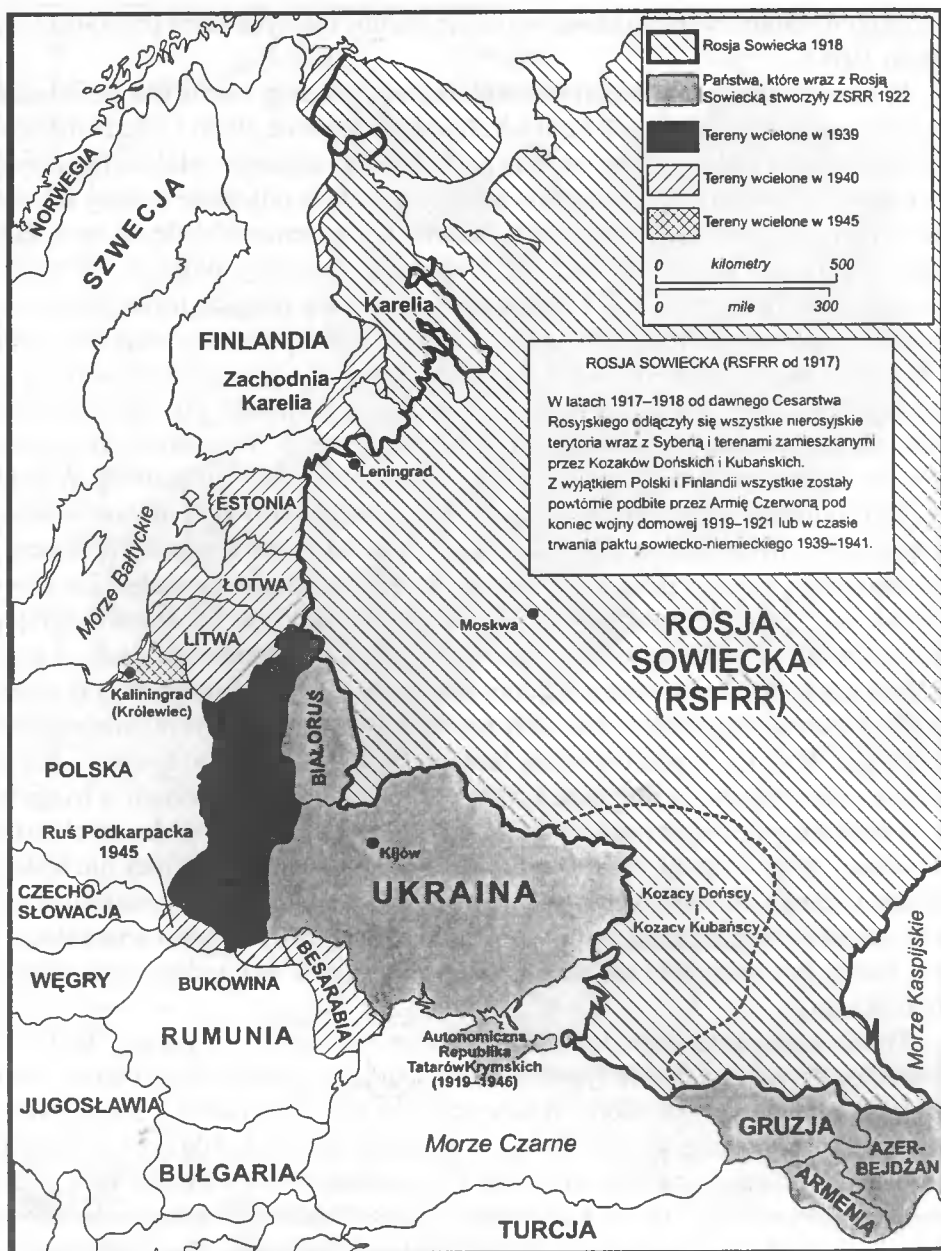
Ryc. 2. Sowiecka ekspansja terytorialna w Europie (1917-1945)

Źródło: Davies N., 1998. Europa. Znak , Kraków