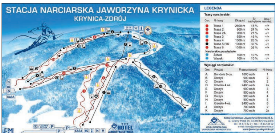
Ryc. 3. Plan stacji narciarskiej Jaworzyna Krynicka

Tak samo jak zmienia się obraz uzdrowiska, zmienia się obraz stacji narciarskich. W kurortach zaczynają dominować ludzie młodzi poszukujący nie tyle leczenia sanatoryjnego, co regeneracji organizmu w obiektach SPA (Dorocki, Brzegowy, 2014). Uwarunkowania kulturowe oraz dominujący model rodziny w Polsce wpływają na coraz większe zainteresowanie pobytami w uzdrowiskach samotnych kobiet oraz kobiet z dziećmi. Dlatego tak znaczący udział w większości kurortów mają obecnie ośrodki oferujące usługi typu spa and welles dla kobiet. Również funkcjonowanie w analizowanych ośrodkach przedszkoli narciarskich dla dzieci lub tzw. kącików malucha z wykwalifikowaną kadrą pedagogiczną potwierdza duży udział rodziców z dziećmi wśród klientów wyciągów narciarskich. Do górskich miejscowości uzdrowiskowych przybywają osoby poszukujące wypoczynku, rekreacji i zabawy.