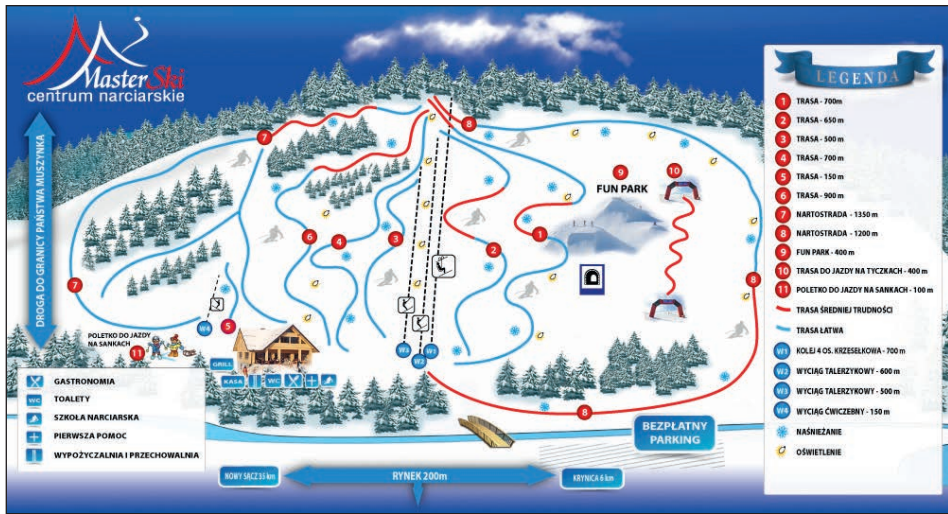
Ryc. 2. Plan stacji narciarskiej MasterSki w Tyliczu